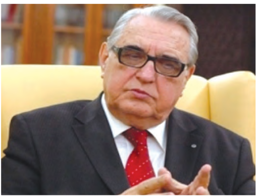
Рајко Кузмановић (2006. - 2010.)

Сви, од народа изабрани народни посланици, у протеклих 25 година постојања Народне скупштине, непосредно су оснажили и демократски развој Републике Српске. И они који ће бити бирани, овјериће слободу нашега народа и наше право да своју заједницу развијамо, између осталог и доносећи законе примјерене времену и потребама напретка државе и народа.