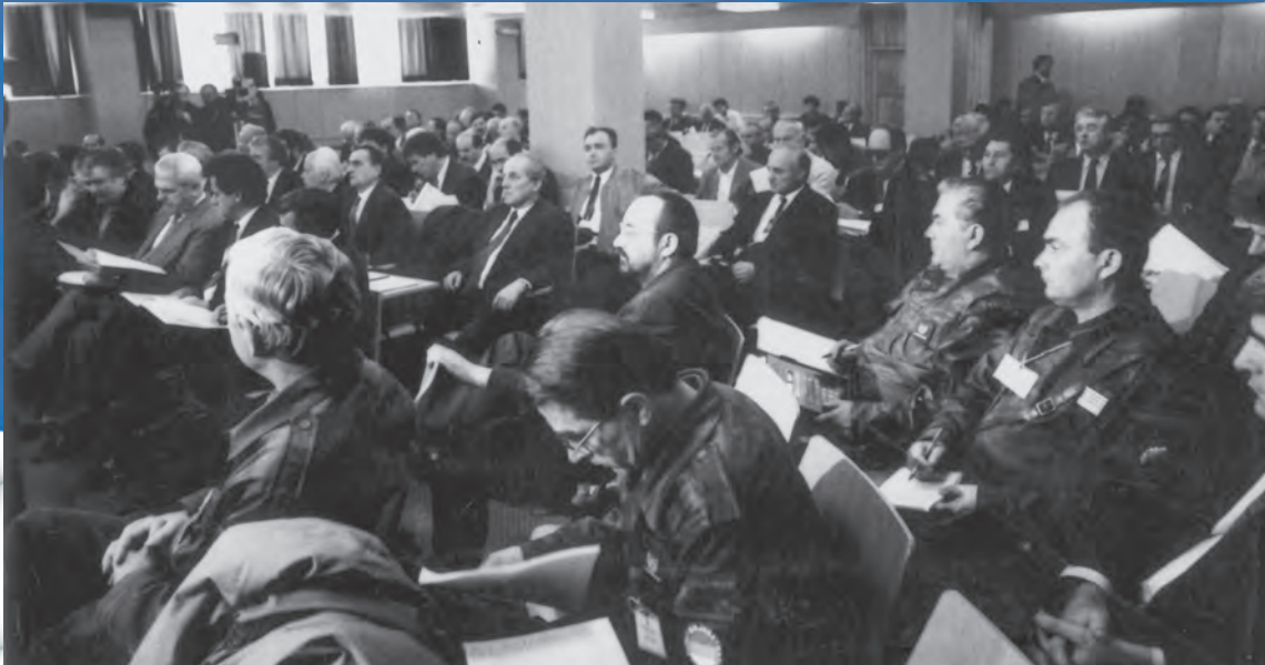
Једна од ратних сједница Првог сазива НСПС