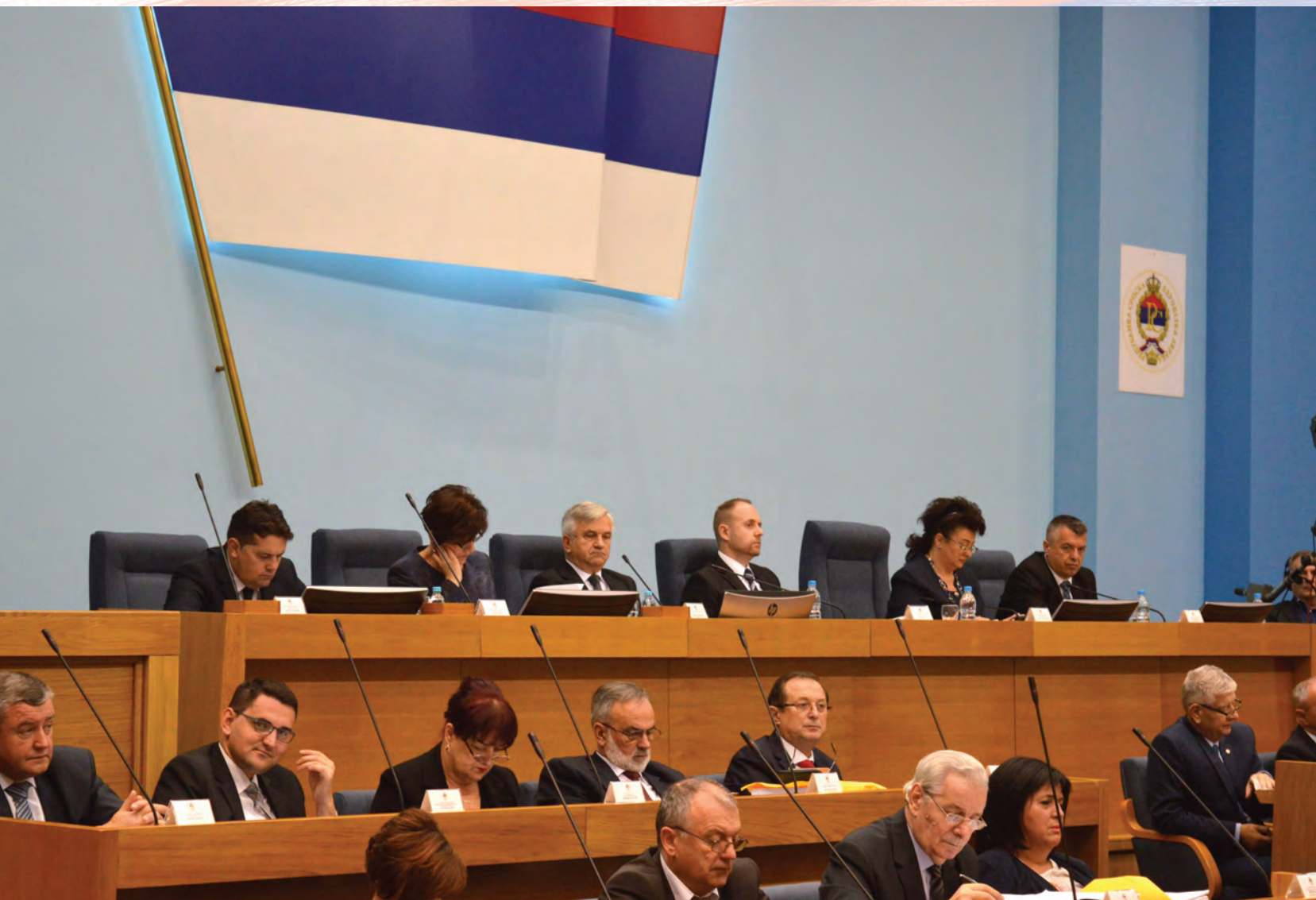
Народна скупштина 25. рођендан дочекује у деветом сазиву

Пише: Боро Благојевић, помоћник генералног секретара Народне скупштине