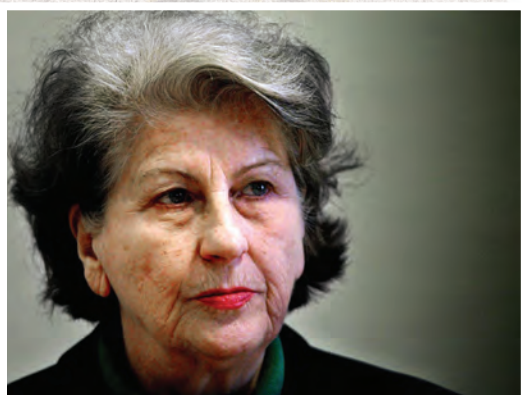
Биљана Плавшић (1996. - 1998.)

Неопходно је да ми у Републици Српској и у будућности одржимо наше јединство, како на принципијелним националним и државним питањима не би било никаквих разлика. Изузетно је важно обезбиједити дијалог свих релевантних политичких фактора у Републици Српској, те градити заједничку стратегију да би Република Српска била оснажена и добро позиционирана. Улога Народне скупштине Републике Српске је у томе кључна.