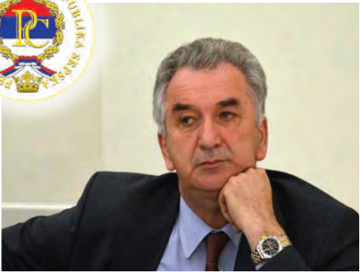
Мирко Шаровић (2000. - 2002.)

У мојим очима Народна скупштина свих ових 25 година била је кључна, темељна институција Републике Српске која је дала печат њеном стварању и послеријатном одржању и развоју. Тај круцијални значај упркос неким покушајима да се мјесто одлу-