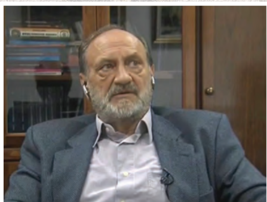
Никола Поплашен (1998. - 1999.)

Кад се све то сагледа и стави и контекст хаоса на терену, међу народом, и прегласавања Срба и у Предсједништву и тадашњој Влади, јасно је зашто смо 25. октобра били присиљени да формирамо Скупштину српског народа. Напросто, то је био наш одговор на правно насиље које нам је учињено.