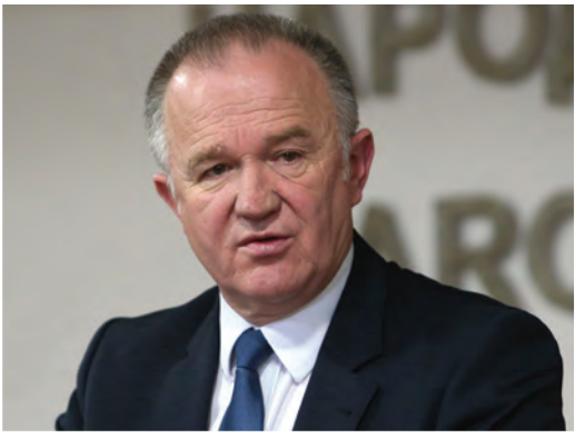
Драган Чавић (2002. - 2006.)

чивања измјести изван народног представничког тијела није изгубила ни данас. Поштујем ту узвишену улогу коју је имала Народна скупштина и поштовао сам је и док сам био предсједник Републике Српске.