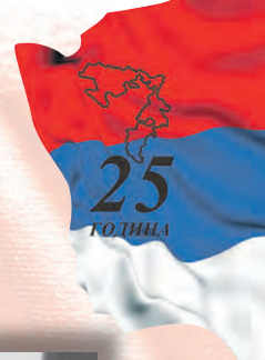
Скупштина Српске Републике БиХ, мај 1992.