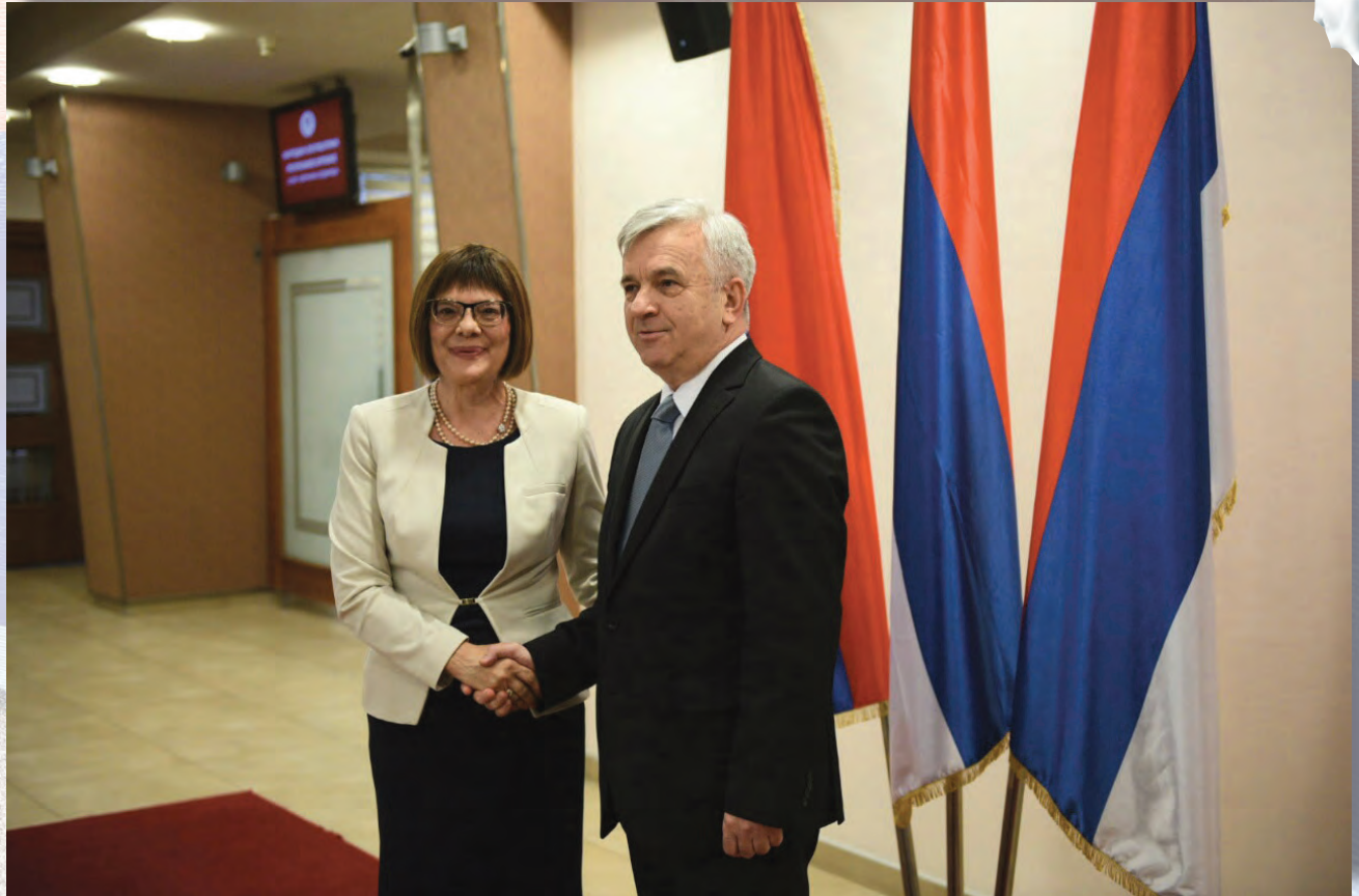
Предсједница Народне скупштине Србије Маја Гојковић у посјети Скупштини Српске