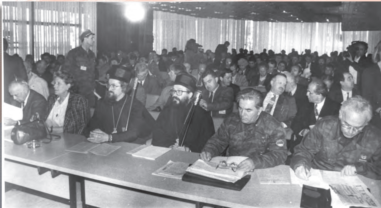
28. редовна сједница првог сазива Народне скупштине одржана је у Новом Граду