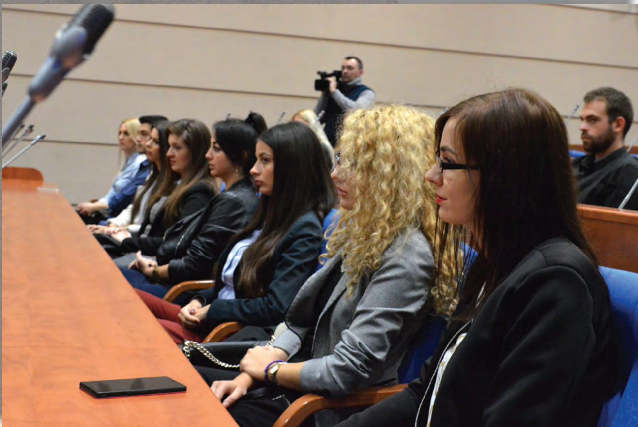
Осамнаеста класа стажиста Народне скупштине (септембар 2016. године)