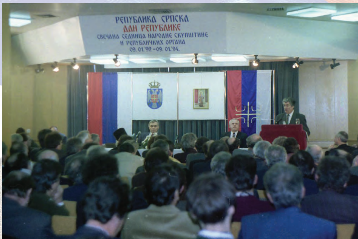
Свечана сједница Народне скупштине одржана поводом Дана Републике (1994. године)