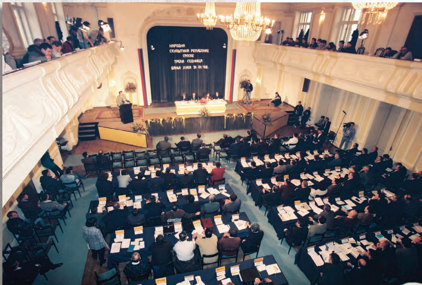
Сједница трећег сазива Народне скупштине у Бањалуци 31.1.1998.