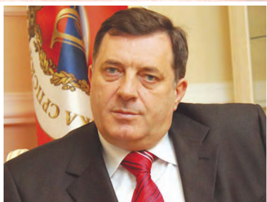
Милорад Додик, актуелни предсједник Српске

Незаобилазна чињеница јесте да је Република Српска створена вољом српског народа, на демократски начин, како су то чиниле и многе друге заједнице у